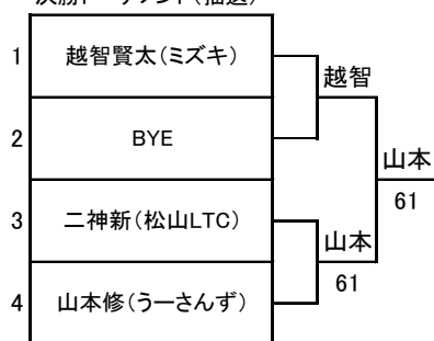
決勝トーナメント(抽選)