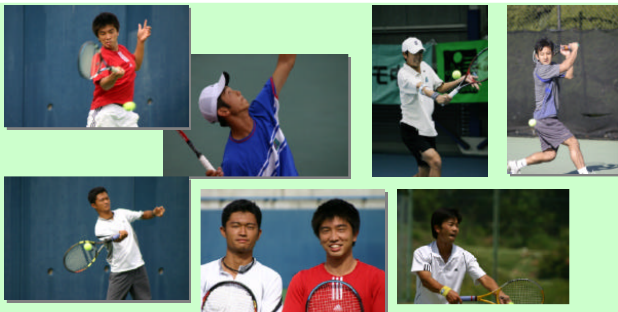
イメージ写真（伊予銀行テニス部）